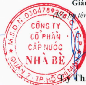
Ly Thành Tài