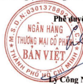
Lý Công Nha