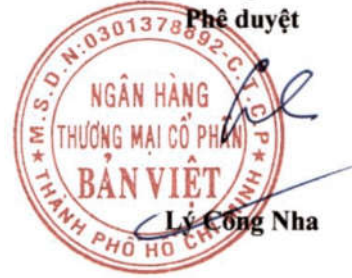
Lý Công Nha