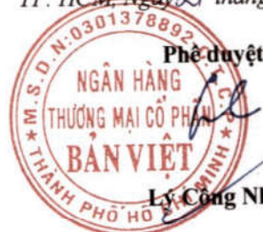
Phê duyệt Lý Công Nha