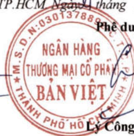
Lý Công Nha