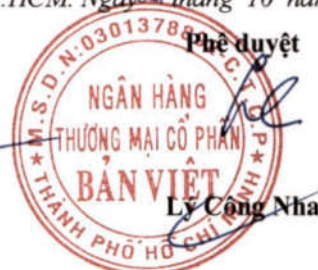
Lý Công Nha