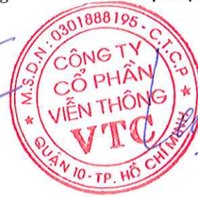
LÊ XUÂN TIẾN