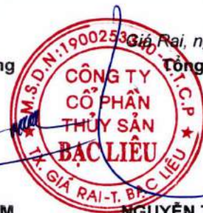
TRẦN CHÍ NAM