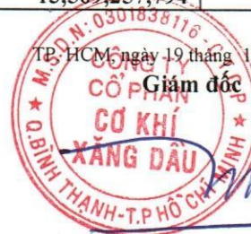
Đoàn Đắc Học