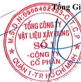
Cao Trường Thu