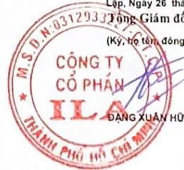
ĐANG XUÂN HỮU