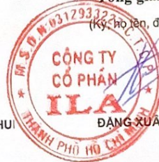
ĐANG XUÂN HỮU