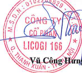
Vũ Công Hưng