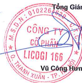
Vũ Công Hưng