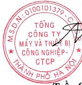
Trần Quốc Toàn