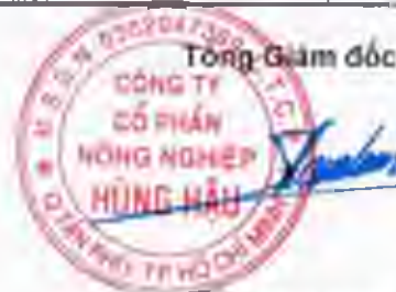
Tổng Giám đốc