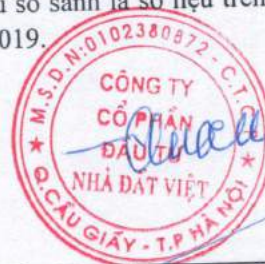
Trần Quốc Huy Chủ tịch HĐQT