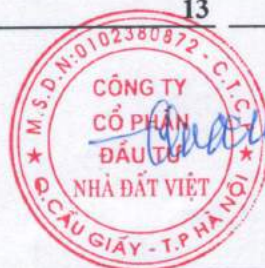
Trần Quốc Huy Chủ tịch HĐQT