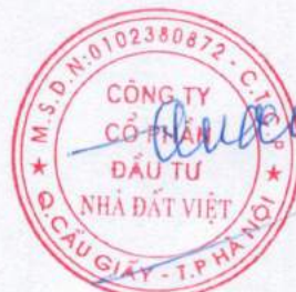
Trần Quốc Huy Chủ tịch HĐQT