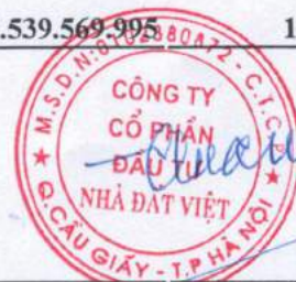
Trần Quốc Huy Chủ tịch HĐQT