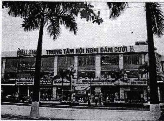
Trung tâm thương mại 25 Đại lộ Lê Lợi