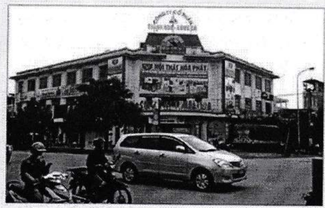
Trung tâm thương mại 301 Trần Phú