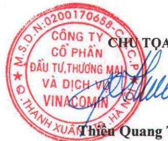
Thiều Quang Thảo