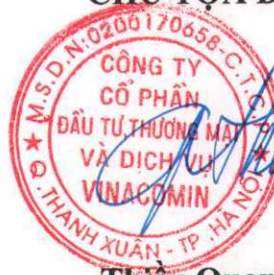
Thiều Quang Thảo