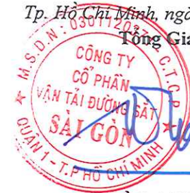
ĐÀO ANH TUẤN

Bản thuyết minh này là một bộ phận hợp thành và phải được đọc cùng với Báo cáo tài chính Văn phòng Công ty