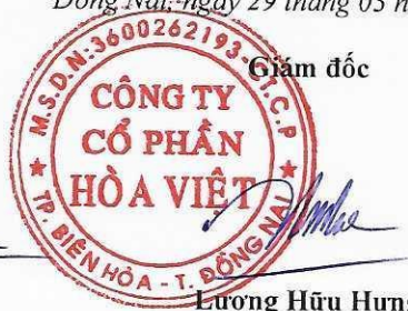
Lương Hữu Hưng