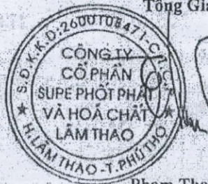
Phạm Thanh Tùng

(Các thuyết minh từ trang 10 đến trang 35 là bộ phận hợp thành của Báo cáo tài chính tổng hợp này)