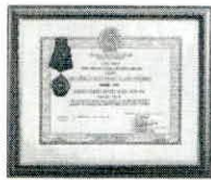
HUÂN CHƯƠNG LAO ĐỘNG HÀNG NHẤT