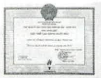
TẬP THỂ LAO ĐỘNG XUẤT SẮC