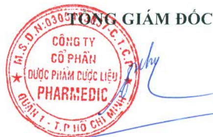
Trần Việt Trung