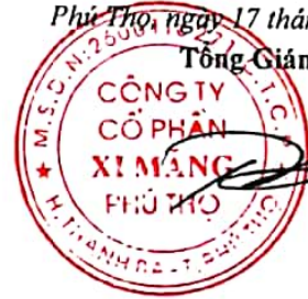
Trần Tuấn Đạt