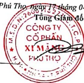
Trần Tuấn Đạt