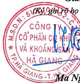
Đỗ Khắc Hùng