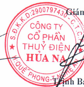
Tỉnh Bảo Ngọc