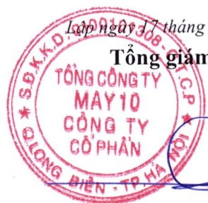
Thân Đức Việt