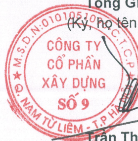
Trần Thạch Tân