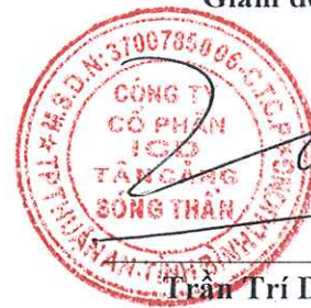
Trần Trí Dũng