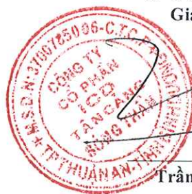
Trần Trí Dũng