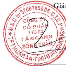
Trần Trí Dũng