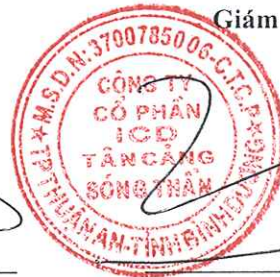
Trần Trí Dũng