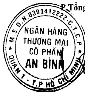
Đỗ Lam Điền