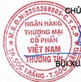
BUI XUÂN KHU