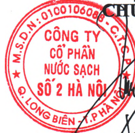
Dương Quốc Tuấn