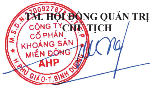
PHẠM XUÂN PHƯƠNG