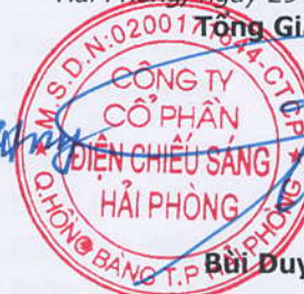
Bùi Duy Đông

Các thuyết minh từ trang 10 đến trang 30 là bộ phận hợp thành của báo cáo tài chính