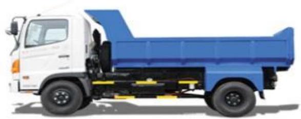
Hủy hàng phế phẩm