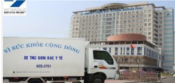
Thu gom chất thải sinh hoạt, chất thải y tế