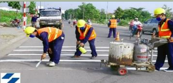
Duy tu đường, mương công thoát nước