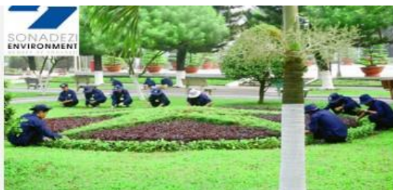
Chăm sóc cắt tỉa cây xanh