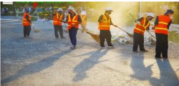
Quét, rửa đường