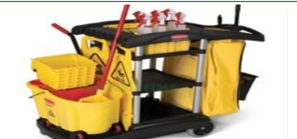
Dọn vệ sinh công nghiệp