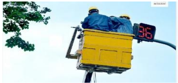
Thi công, duy tu sửa chữa hệ thống điện, chiếu sáng