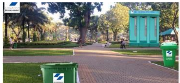
Kinh doanh thùng rác, nhà vệ sinh