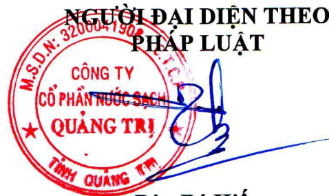
Đào Bá Hiều Chủ tịch HĐQT