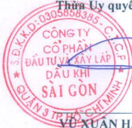
VÕ XUÂN HẢI