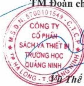
Wu The Ban