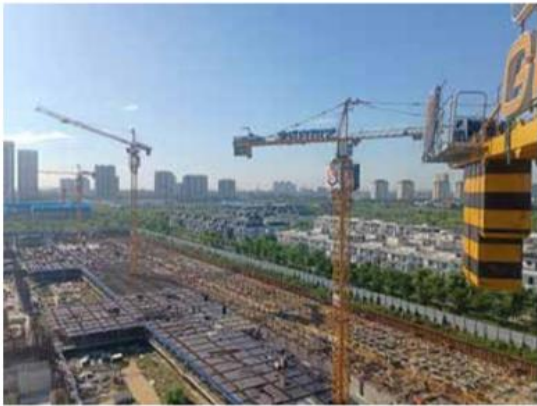
Dự án Sunshine Crystal River