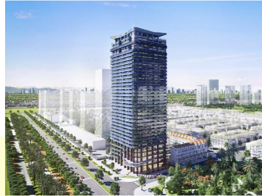
Dự án Sunshine Golden River