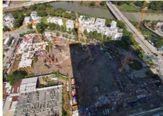
Dự án Sunshine Horizon

Đặc biệt vào ngày 12/01/2020 SCG, được Chủ đầu tư tin tưởng giao làm tổng thầu Dự án Empire với quy mô rất lớn (03 tầng hầm với 05 tòa tháp trong đó 02 tòa tháp cao 47 tầng, 01 tòa cao 35 tầng và 02 tòa cao 39 tầng, diện tích khu đất: 52.095,5 m 2 . Tổng giá trị khoảng 5.000 tỷ đồng).