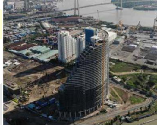
Dự án Sunshine Diamond River