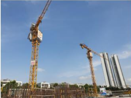
Dự án Sunshine City Sài Gòn