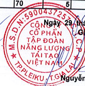
Nguyễn Tường Cọt