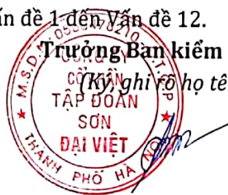
Trương Thị Mai