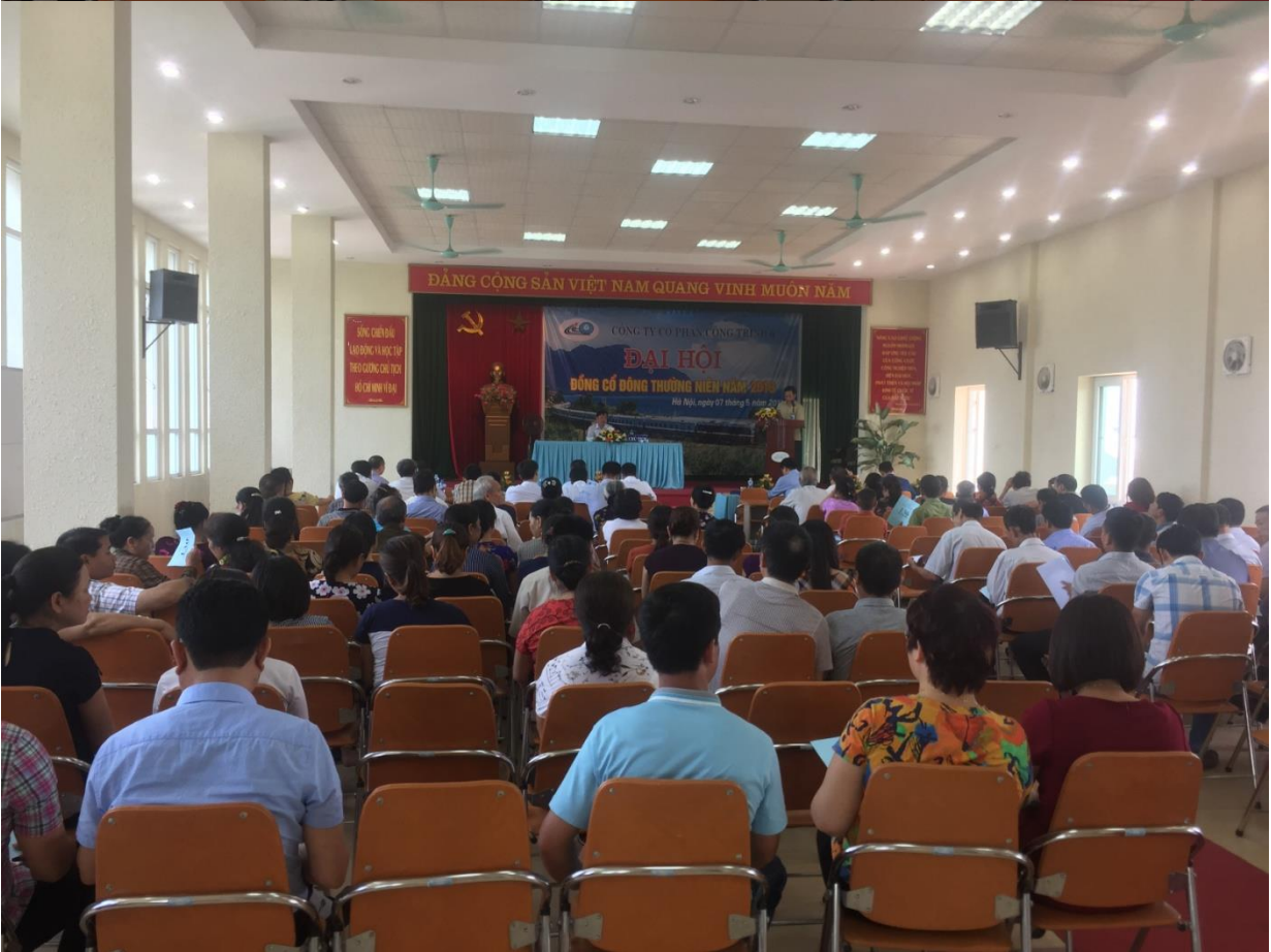
Đại hội đồng cổ đông thường niên 2019