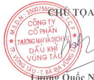
Lương Quốc Nam