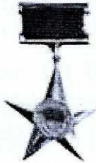
Anh hùng LLVT Nhân dân