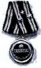
Huân chương Độc lập Hàng Nhất