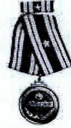
Huân chương Độc lập Hàng Ba