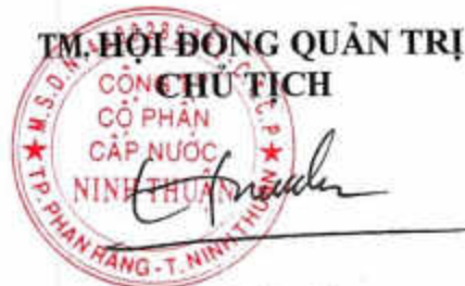
Phạm Hữu Sơn

9. Thể lệ làm việc và biểu quyết này được đọc trước Đại hội đồng cổ đông và lấy ý kiến biểu quyết của các cổ đông. Nếu được Đại hội đồng cổ đông thông qua với tỷ lệ từ 65% tổng số phiếu biểu quyết của tất cả cổ đông dự họp trở lên, Thể lệ này sẽ có hiệu lực thi hành bắt buộc đối với tất cả các cổ đông.