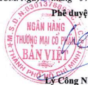
Ly Công Nha