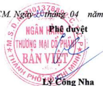
Lý Công Nha