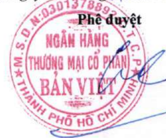
Lý Công Nha