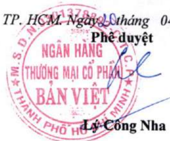
Lý Công Nha