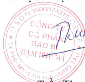
Trần Thượng Tín