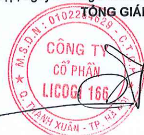
Vũ Công Hưng