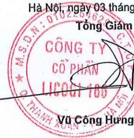
Vũ Công Hưng