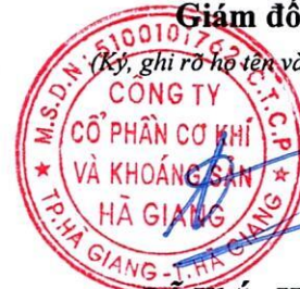
Đỗ Khắc Hùng