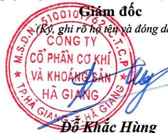
Đỗ Khắc Hùng