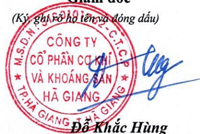
Đỗ Khắc Hùng