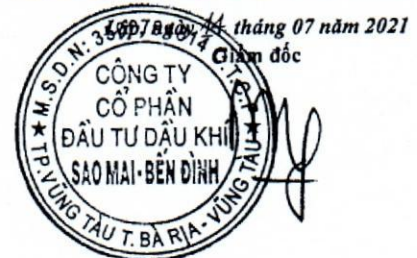
Phùng Như Dũng