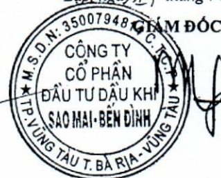
Phùng Như Dũng