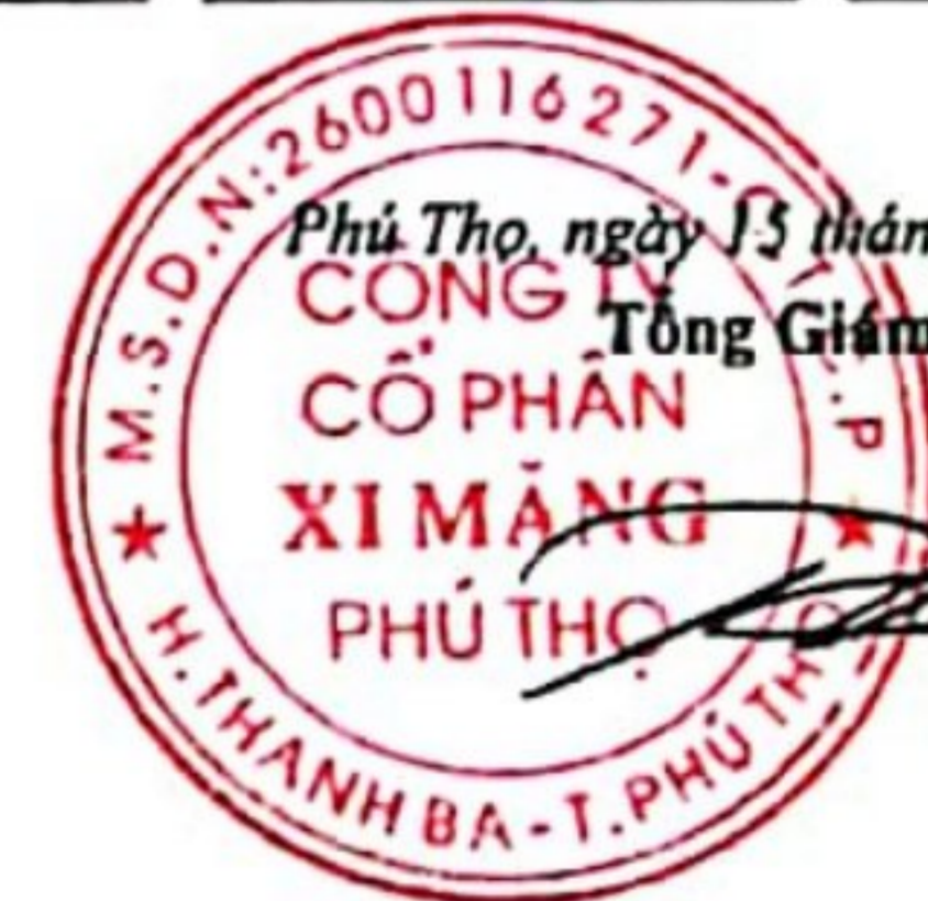
Trần Tuấn Đạt