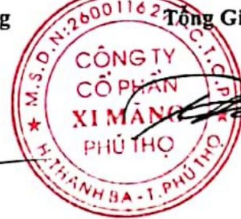
Trần Tuấn Đạt