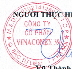
Vũ Thành Kiên