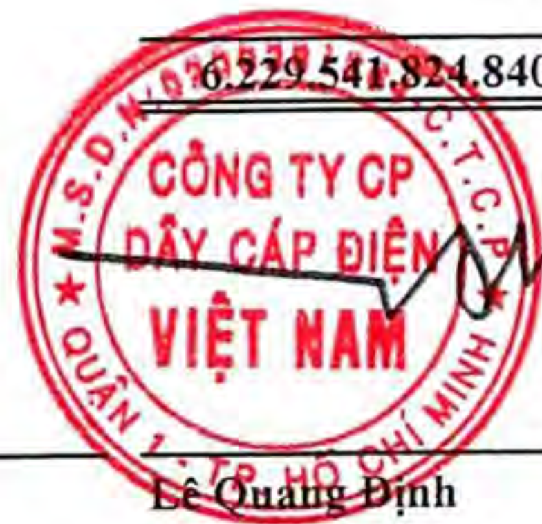
Lê Quang Định