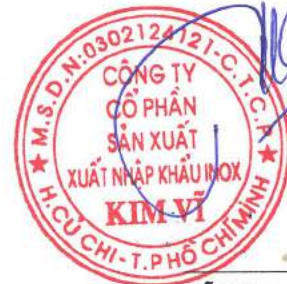
Đỗ Hùng Chủ tịch Hội Đồng Quản Trị