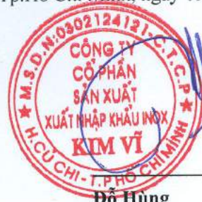
Đỗ Hùng Chủ tịch Hội Đồng Quản Trị